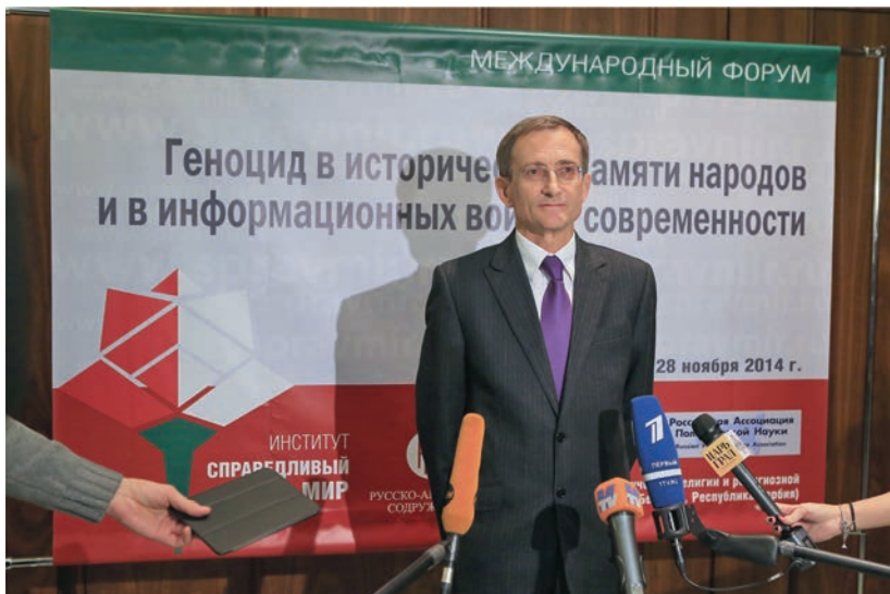
На Международном форуме «Геноцид в исторической памяти народов и в информационных войнах современности», 28 ноября 2014 г.