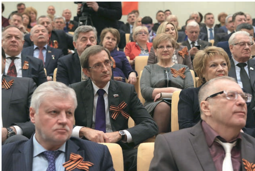
Встреча российских парламентариев с делегацией Крыма в Малом зале Государственной Думы, 19 марта 2014 г.