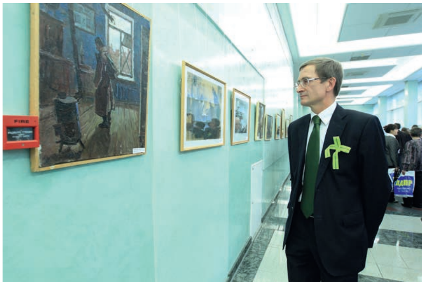
Историко-художественная выставка «Подвиг Ленинграда» в Государственной Думе, 4 февраля 2014 г.