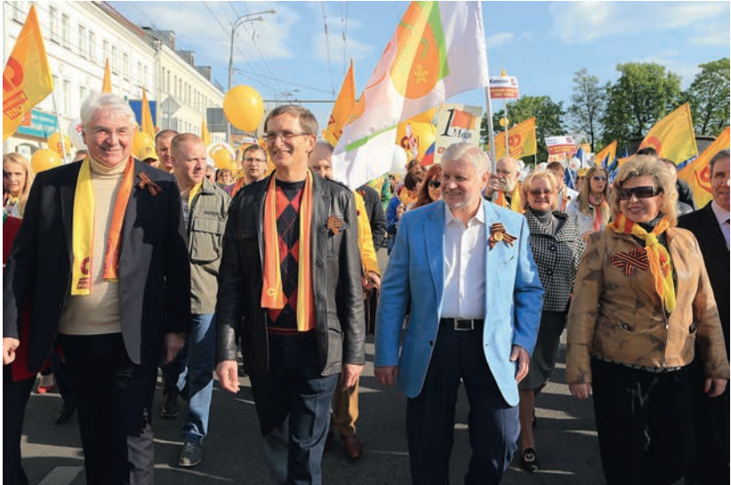
На демонстрации 1 мая 2014 г.