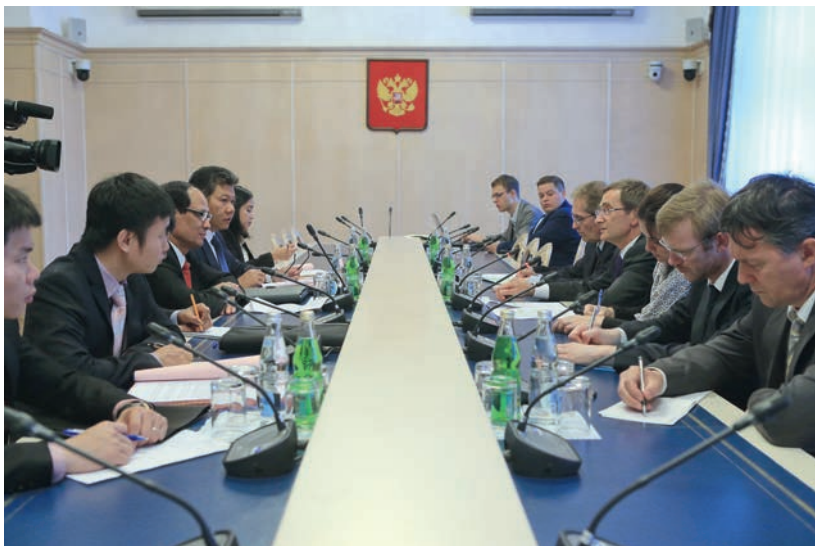
Встреча с Генеральным секретарем АСЕАН в Гербовом зале Государственной Думы, 1 июля 2014 г.