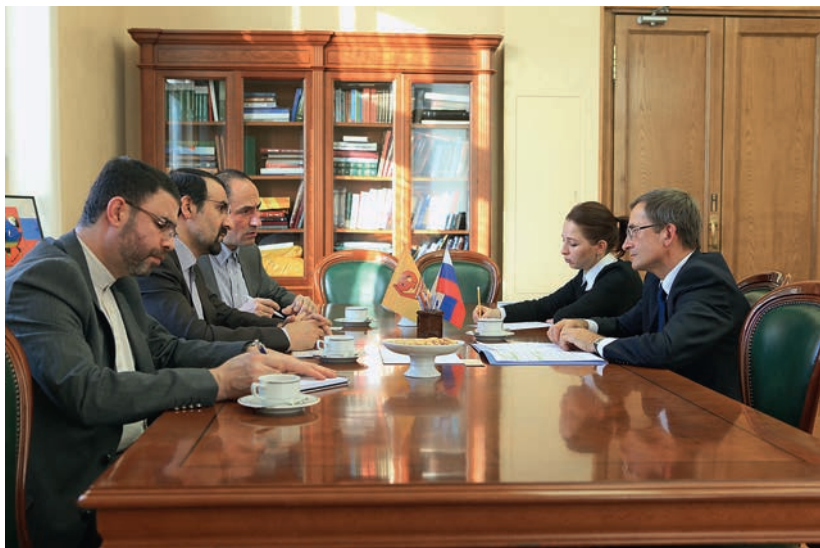
Встреча с Послом Исламской Республики Иран в России Мехди Санаи, 21 января 2014 г.