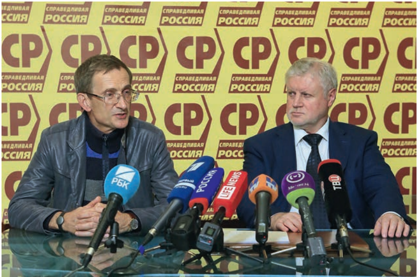
Брифинг после завершения Единого дня голосования, 14 сентября 2014 г.