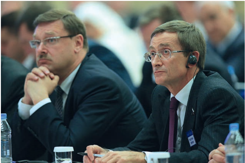
С Константином Косачёвым на международном парламентском форуме «Новые измерения парламентского диалога в современный период», 26 июня 2014 г.