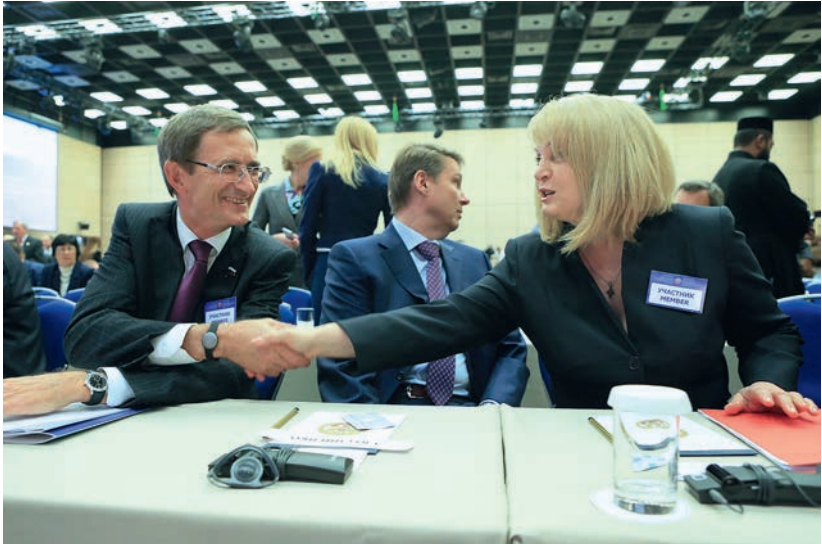
С Элой Памфиловой на международном парламентском форуме «Новые измерения парламентского диалога в современный период», 26 июня 2014 г.