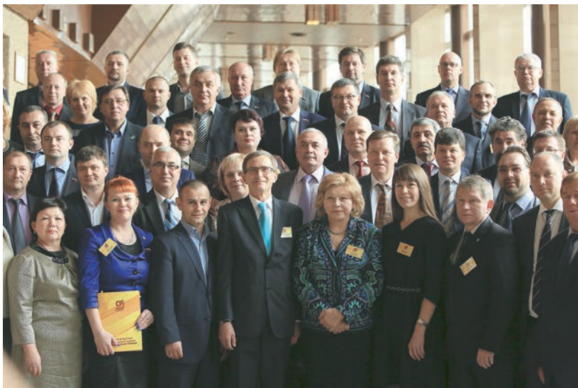
С депутатским корпусом Партии СПРАВЕДЛИВАЯ РОССИЯ , 5 апреля 2014 г.