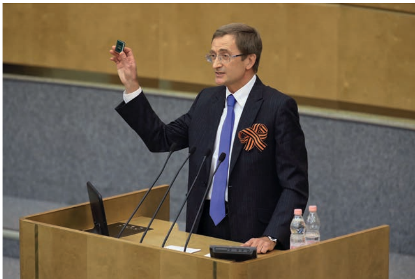
Выступление с трибуны Государственной Думы, 18 марта 2014 г.