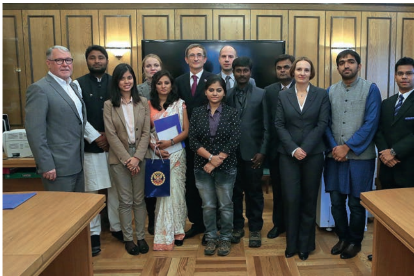
Встреча с делегацией молодых индийских политиков, политологов и экспертов, 6 октября 2014 г.