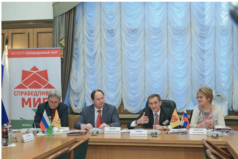
Круглый стол «Справедливость как ценность, идея и общественная практика в российском обществе и современном мире», 3 декабря 2014 г.