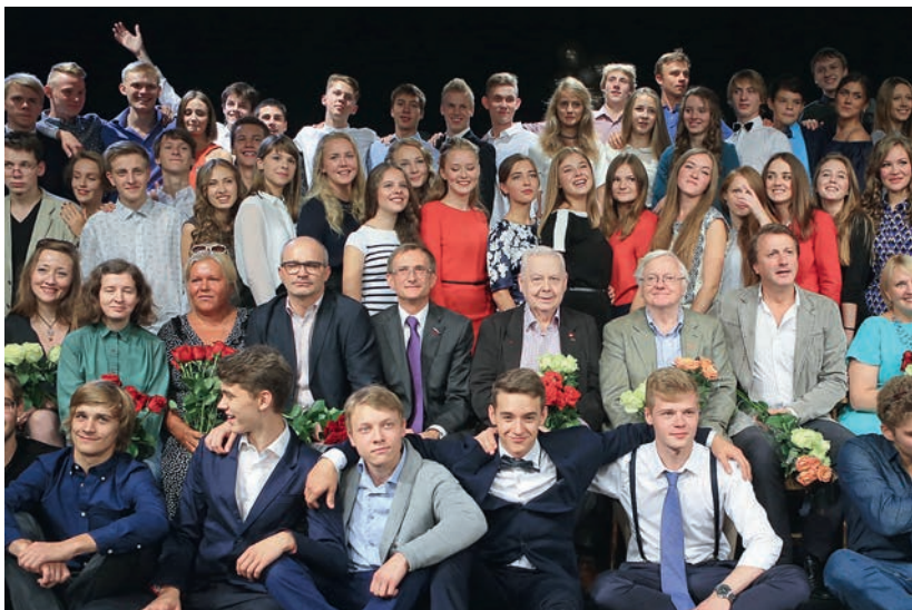
В День знаний в Московском театральном колледже Олега Табакова, 1 сентября 2014 г.