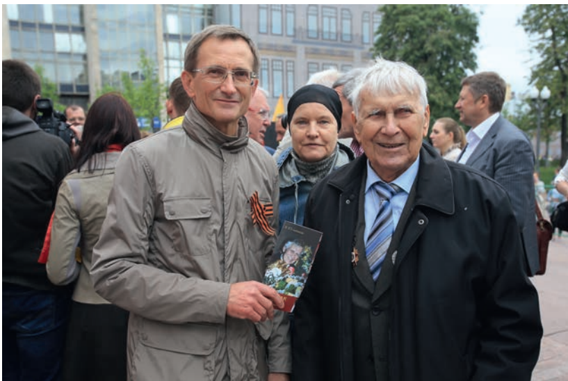
С легендарным директором Театра на Таганке, заслуженным артистом РСФСР, заслуженным артистом Украины Николаем Лукьяновичем Дупаком, 11 июля 2014 г.