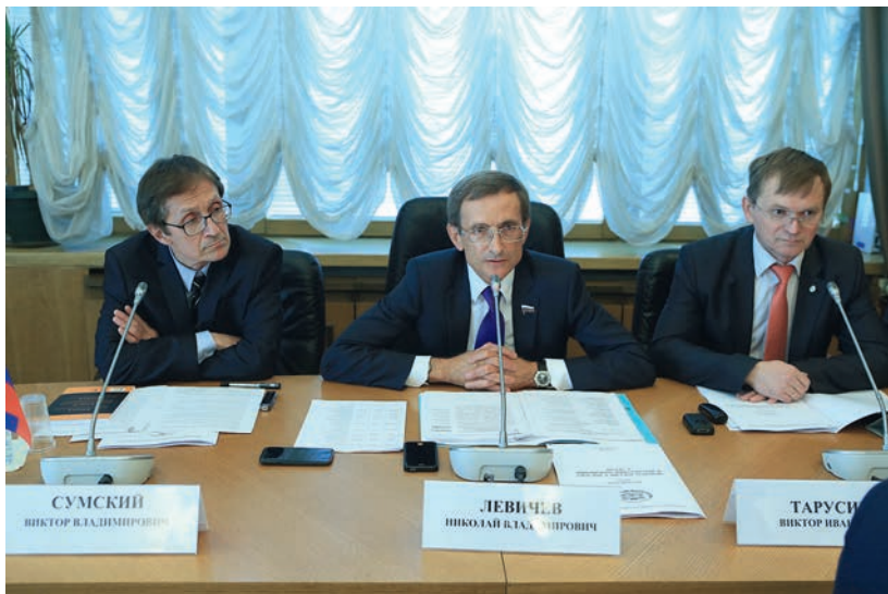
Круглый стол «Поворот России к Востоку и перспективы отношений с АСЕАН», 17 июня 2014 г.