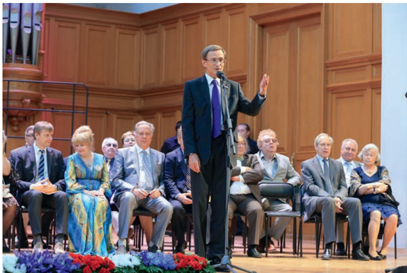
На церемонии Выпускного акта в Московской государственной консерватории им. П.И. Чайковского, 20 июня 2014 г.