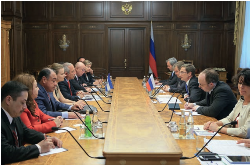
Встреча с парламентской делегацией Республики Эль-Сальвадор в Ореховом зале Государственной Думы, 16 мая 2014 г.