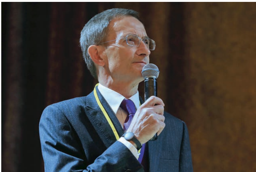
28 ноября 2014 г.