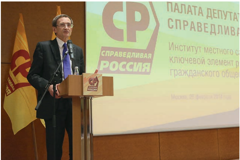
На заседании Палаты депутатов Партии СПРАВЕДЛИВАЯ РОССИЯ , 26 февраля 2014 г.