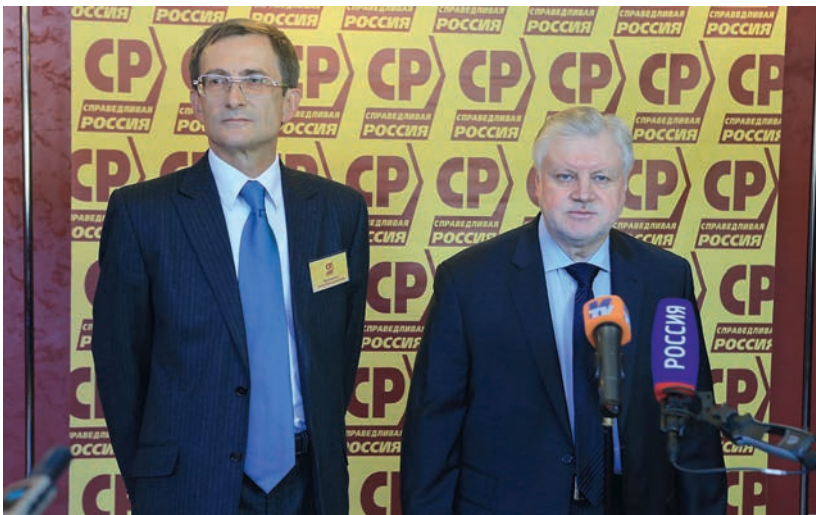
С Сергеем Мироновым на пресс-подходе перед расширенным заседанием Совета Палаты депутатов Партии СПРАВЕДЛИВАЯ РОССИЯ , 5 апреля 2014 г.