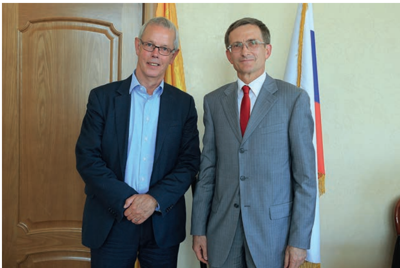
Встреча с председателем Группы объединенных левых ПАСЕ Тини Коксом, 26 мая 2014 г.