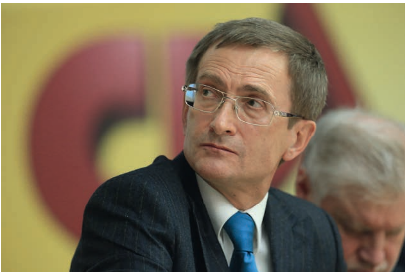
5 апреля 2014 г.