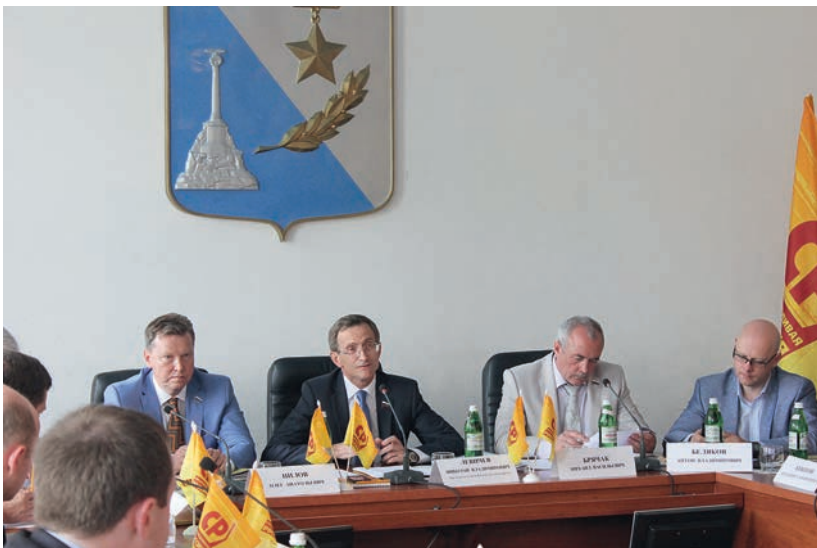
Палата депутатов Партии СПРАВЕДЛИВАЯ РОССИЯ в Севастополе, 27 мая 2014 г.