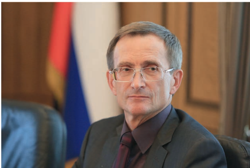
На заседании Президиума Центрального Совета Партии СПРАВЕДЛИВАЯ РОССИЯ , 3 июля 2014 г.