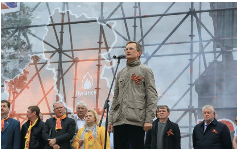
На митинге солидарности с жителями юго-востока Украины, 11 июля 2014 г.