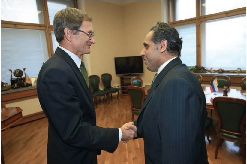
Встреча с Послом Государства Кувейт в России Абдуль-Азизом аль-Адвани, 4 февраля 2014 г.