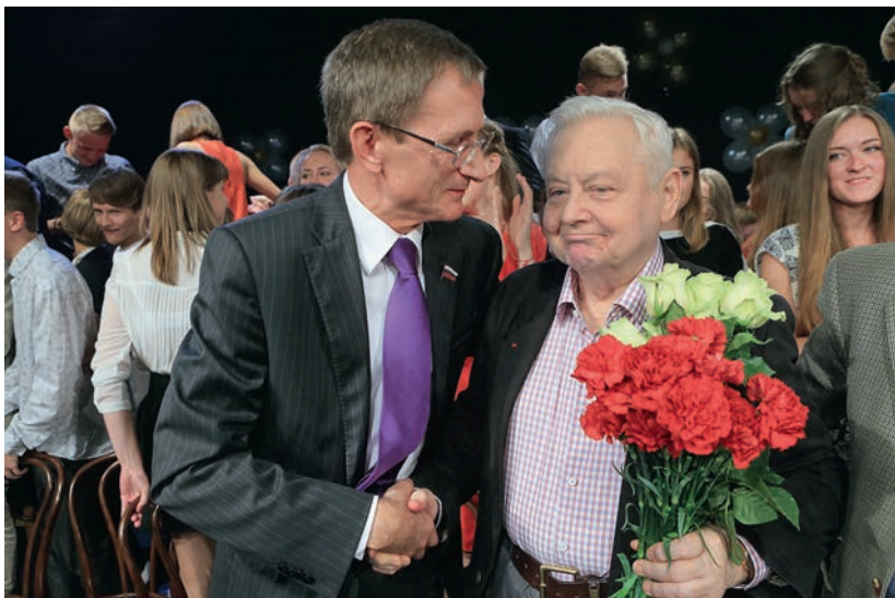
С Олегом Табаковым, 1 сентября 2014 г.