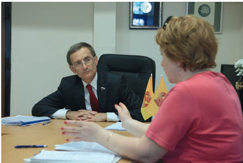
Прием граждан в общественной приемной депутата, 22 мая 2014 г.