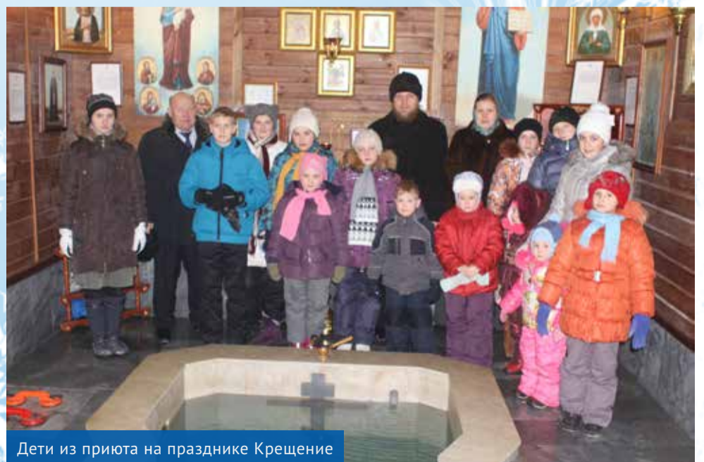
Дети из приюта на празднике Крещение

Настоятели Храмов поздравляют всех прихожан с Рождеством Христовым!