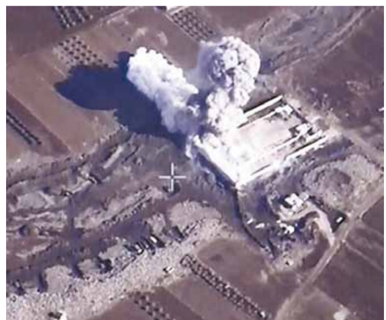
МИНИСТЕРСТВО ОБОРОНЫ РФ

Но курды научились эффективно противостоять ИГИЛ. Сирийская армия, силы народного ополчения, «Хезболла» и иранские вооружённые формирования в общей сложности составляют почти 300 тыс. человек, но они не могут даже закрыть 98 км сирийско-турецкой границы. А курды, не имея ни тяжёлого, ни серьёзного стрелкового вооружения, закрыли более 400 км этой границы. Низкая эффективность правительственной армии и поддерживающих её сил не может не вызывать беспокойства. Поэтому необходимо расширить наше военно-воздушное присутствие в Сирии, увеличивать число авианалётов по ИГИЛ.