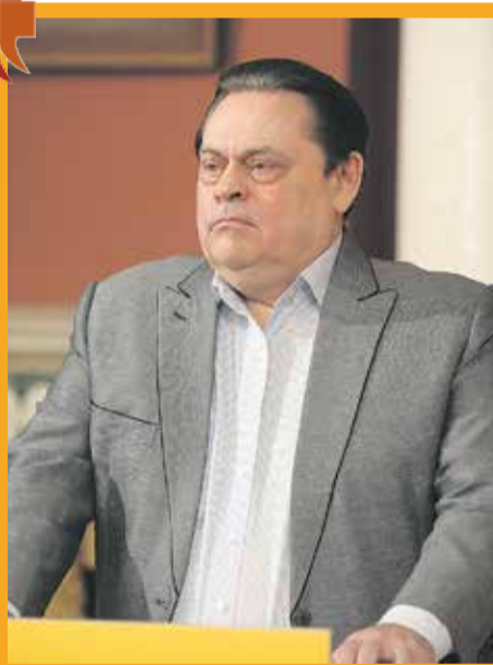
ГЕННАДИЙ СЕМИГИН, сопредседатель Партии СПРАВЕДЛИВАЯ РОССИЯ – ПАТРИОТЫ – ЗА ПРАВДУ:

В Партии СПРАВЕДЛИВАЯ РОССИЯ – ЗА ПРАВДУ уверены, что на демографии экономить нельзя. Депутаты уже подготовили и внесли в Государственную Думу пакет законов, которые позволят изменить эту ситуацию. Это повышение минимальной зарплаты до 31 тысячи рублей и введение Справедливого базового дохода для семей с детьми – ежемесячных выплат по десять тысяч рублей.